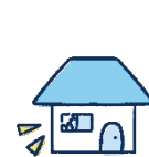
左記以外の 偶然な破損事故等

*2 「融雪水の漏入もしくは凍結、融雪洪水または除雪作業による事故」を除きます。 *3 床上浸水、地盤面より45cmを超える浸水、または損害割合が30%以上の場合があります。 *4 給排水設備に生じた事故による水濡れ、または他の戸室で生じた事故による水濡れをいいます。