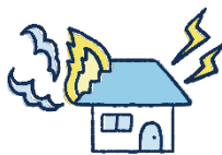
火災・落雷・破裂・爆発