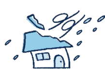
風災・雹災・雪災 *2